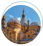
TAVOLA SINOTTICA - GIOVEDÌ 13 FEBBRAIO 2025